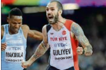
RAMIL GULIYEV (29 ans, Azéri nationalisé Turc en 2011): champion d'Europe et du monde en titre du 200 m avec un record personnel de 19"76.